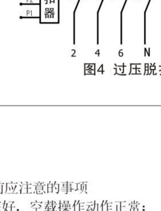
图4 过压脱扣器接线图

额定工作相电压Ue：交流230V 50Hz(或60Hz)。 断路器动作特性：主电路相电压为(85%~110%)Ue时，脱扣器能保持断路器长期工作。当主电路相电压升高至270(1±5%)V时，与断路器组合在一起的脱扣器应动作，使断路器断开。接线图见图4。